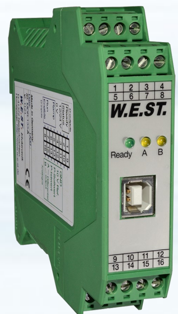
Unten: kompaktes Regelmodul